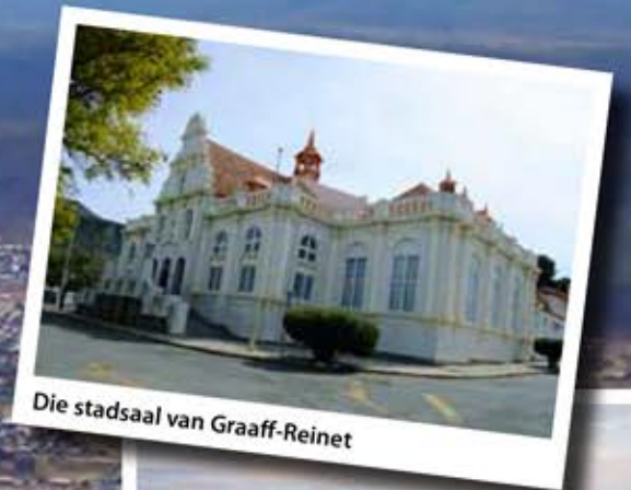
Die stadsaal van Graaff-Reinet

Gedurende die Tweede Anglo Boere-oorlog (1899 – 1902) het Graaff-Reinet 'n hoofsentrum van Britse militêre operasies in die Oos-Kaap geword. Nege Boere is by Graaff-Reinet ter dood veroordeel en voor 'n vuurpeloton tereggestel. Die Burgermonument in Donkinstraat