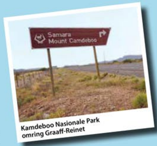
Kamdeboo Nasionale Park omring Graaff-Reinet

1864), wat 18 bergpasse gebou het, insluitend Bainskloofpas, Mitchellspas, Oubergpas en Van Ryneveldpas, het meer as drie jaar lank op Graaff-Reinet gewoon. Sy seun, Thomas Charles Bain (1830-1893) het 24 bergpasse gebou.