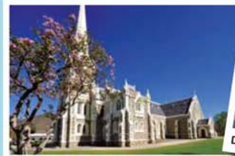
Die NG kerk

Die bekende Suid-Afrikaanse sendeling aan die Voortrekkers, Andrew Murray, wie se bediening met die uitsonderlikste herlewing in die Suid-Afrikaanse geskiedenis