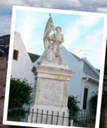
HEEL LINKS: Andries Pretorius Monument. LINKS: Dié monument is opgerig vir die boere wat gesneuwel het tydens die Anglo-Boereoorlog