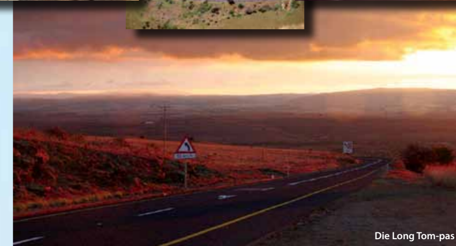
Die Long Tom-pas

Lydenburg is een van die oudste dorpe in Mpumalanga met 'n ryke geskiedenis van die Anglo-Boereoorlog en pragtige ou geboue wat behoue gebly het.